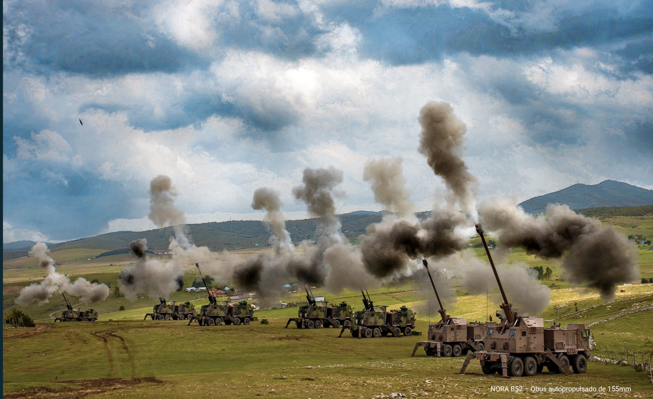
NORA B52 – Obus autopropulsado de 155mm

A política de qualidade da Empresa Pública Jugoimport-SDPR é parte integrante da política empresarial e representa um meio de gestão para atingir os objetivos empresariais definidos. Muitos anos de posse / manutenção do certificado ISO 9001, como prova internacionalmente reconhecida da qualidade da empresa, é mais uma confirmação de que a Jugoimport-SDPR aplica padrões modernos de renome mundial no seu negócio, garantindo assim uma excelência empresarial duradoura.