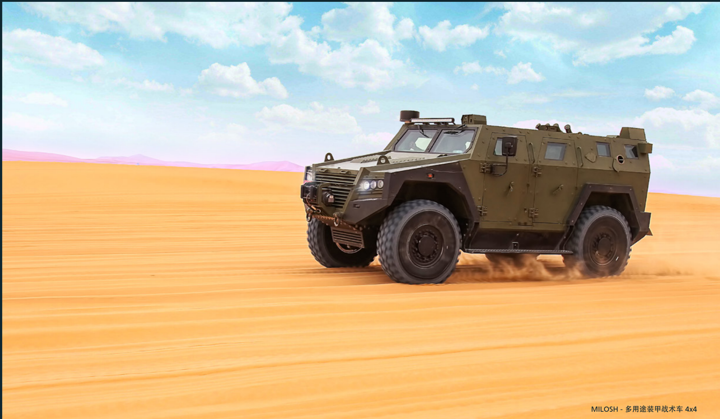
MILOSH - 多用途装甲战术车 4x4