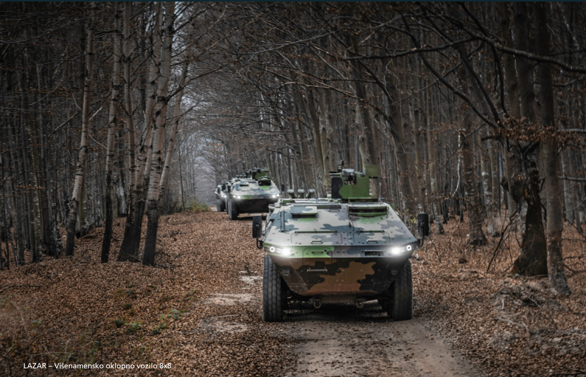
LAZAR – Višenamensko oklopno vozilo 8x8