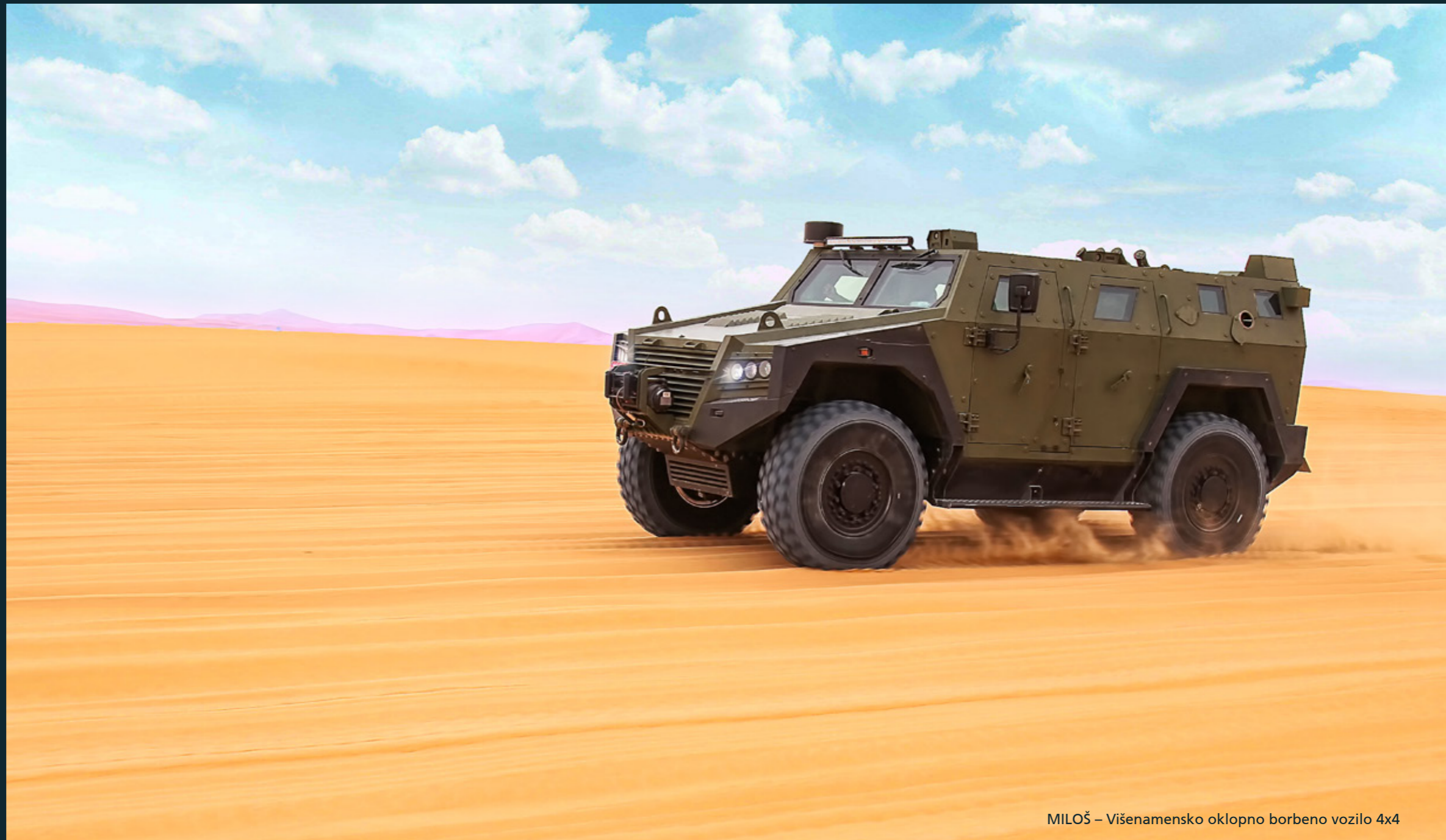
MILOŠ – Višenamensko oklopno borbeno vozilo 4x4